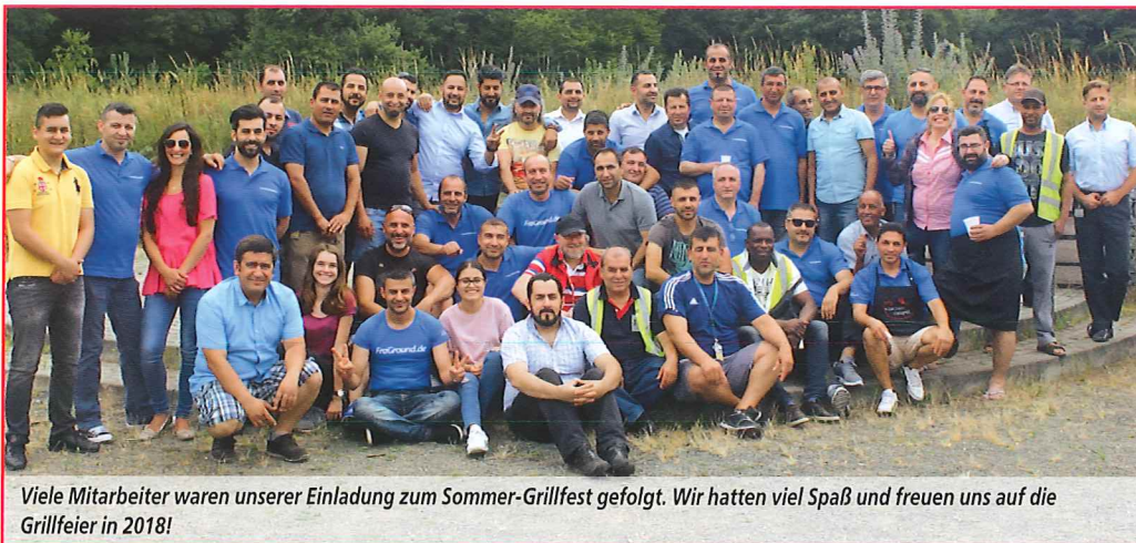
Viele Mitarbeiter waren unserer Einladung zum Sommer-Grillfest gefolgt. Wir hatten viel Spaß und freuen uns auf die Grillfeier in 2018!

Fragen zu diesem Thema beantwortet der FraGround-Betriebsrat gern.