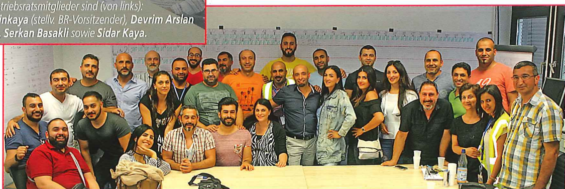
Die vielen Wahlhelfer haben die 3-tägigen FraGround-Betriebsratswahlen möglich gemacht.